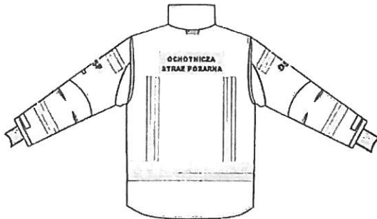
Przykładowy widok kurtki