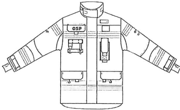
Przykładowy widok kurtki